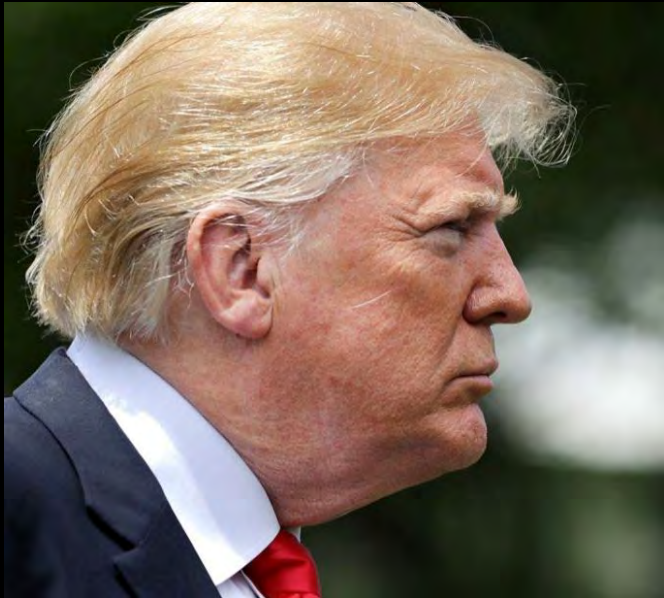
DONALD TRUMP Presidente degli Stati Uniti d'America

I due personaggi che interpretano tale duplice posizione sono: Donald Trump, presidente degli USA, famoso per la sua politica conservatrice ed isolazionista, mentre la seconda è Greta Thumberg, simbolo del movimento che si batte per la lotta contro i cambiamenti climatici.